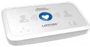
Telemonitoring wordt steeds meer toegepast.